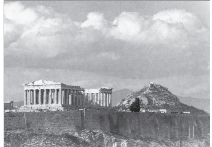
El emporio de filosofía en Atenas

“He aquí que Dios es grande, pero no desprecia a nadie”